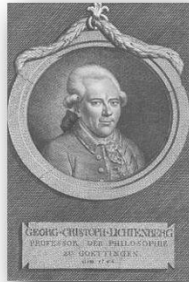
Georg Christoph Lichtenberg